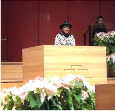
DEE DEE BRIDGEWATER

ohessa hän kävi koelauluissa. Koska miljoonakaupungissa hinku alalle on valtava ja kilpailu veristä, käy usein niin, että koelaulu päättyy ennen kuin jonon loppupää saa vuoron.