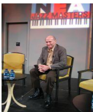
DAVE LIEBMAN PANEELISSA