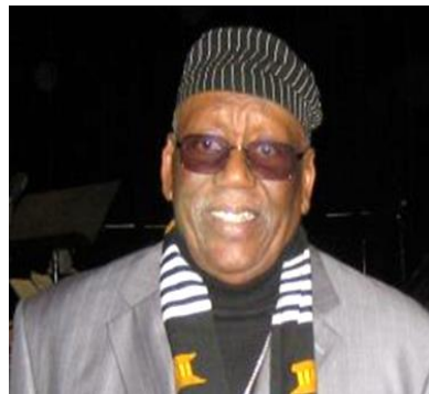
RANDY WESTON SYMPHONY SPACESSA