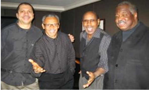
SONNY FORTUNE QUARTET