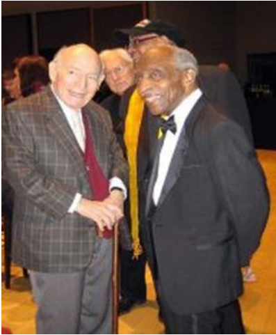
GEORGE WEIN, LEE KONITZ, JIMMY OWENS JA JOE WILDER