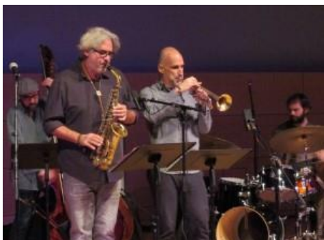
TIM BERNE JA RALPH ALESSI