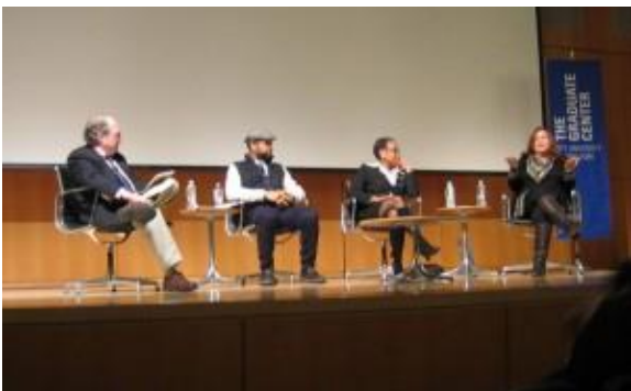
JAZZ AND NEW YORK PANELISTIT

Koska asumiskustannukset nykyisin ovat suuret, keskusteltiin mahdollisista tukimuodoista. Kun otetaan huomioon se valtava määrä muusikoita, jotka sitä tarvitsisivat, arveltiin sen tulevan liian kalliiksi ja olevan mahdoton ajatus. Asiaa pitäisi kuitenkin selvittää.