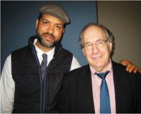
JASON MORAN JA GARY GIDDINS