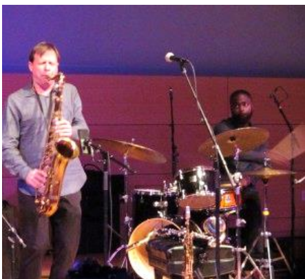
CHRIS POTTER JA MARCUS GILMORE

Intensiivisen puhaltajan Chris Potterin tarkka ja energinen työskentely tunnetaan, mutta nyt uuden yhtyeen siivittämänä näytti syntyvän aivan mieletöntä dynamiikkaa, freesiä jazzia, jossa ei kuolleita hetkiä eletty.